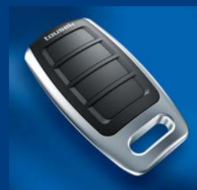
tousek Impulsgeberprogramm kompatibel und sicher