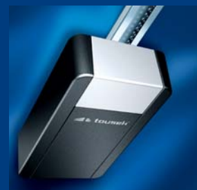
tousek Garagentorantriebe sparsam und schnell