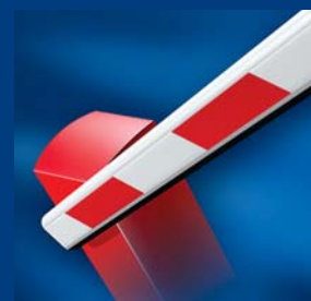
tousek Schrankensysteme formschön und robust